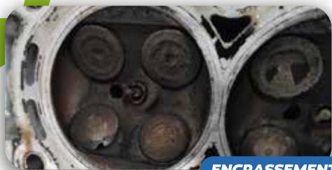
ENCRASSEMENT - 1.2L PURETECH