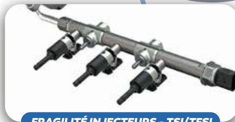
FRAGILITÉ INJECTEURS - TSI/TFSI

Les moteurs à injection directe sont conçus pour pulvériser le carburant directement dans la chambre de combustion, sans que celui-ci ne passe par les soupapes d'admission. Cela les rend plus susceptibles à l'encrassement par la calamine , contrairement aux moteurs à injection indirecte où le carburant nettoie les soupapes.